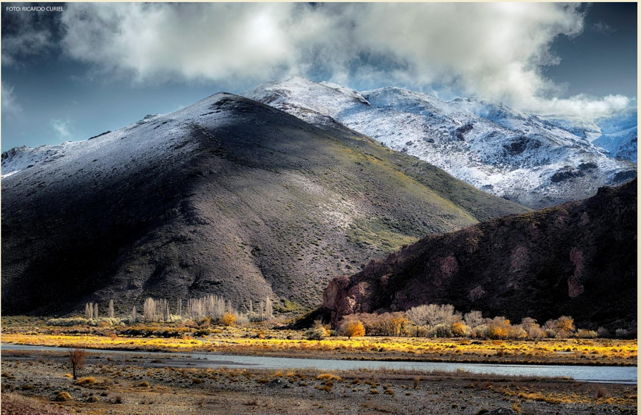
Camino Bardas Río Grande