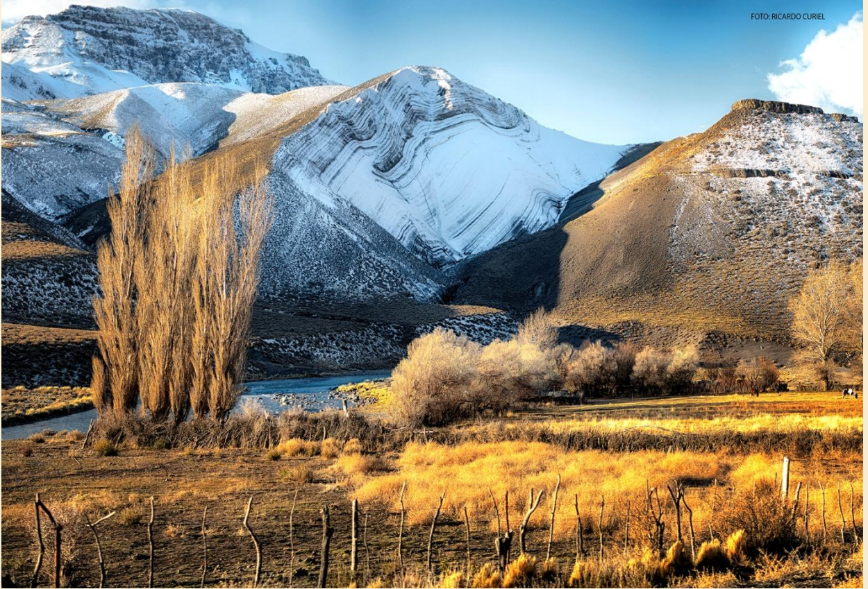
Camino Bardas Montaña Cortada